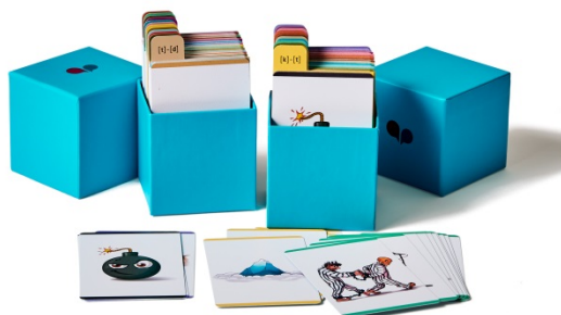
Figur 1: Sprogeriets bombespil fra Minimale Par-kassen. Læs mere om det her: https://sprogeriet.dk/minimale-par

Kort om aktiviteten/metoden: Bombespil har været min favoritaktivitet til børn med udtaleproblematikker, siden jeg lærte spillet at kende i 2018. Spillet findes i Sprogeriets Minimale