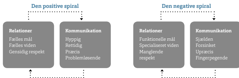
Figur 1. Den positive og den negative spiral i relationel koordinering